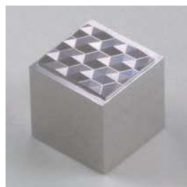
ワークサイズ: 20 × 20mm Work size: 20×20mm